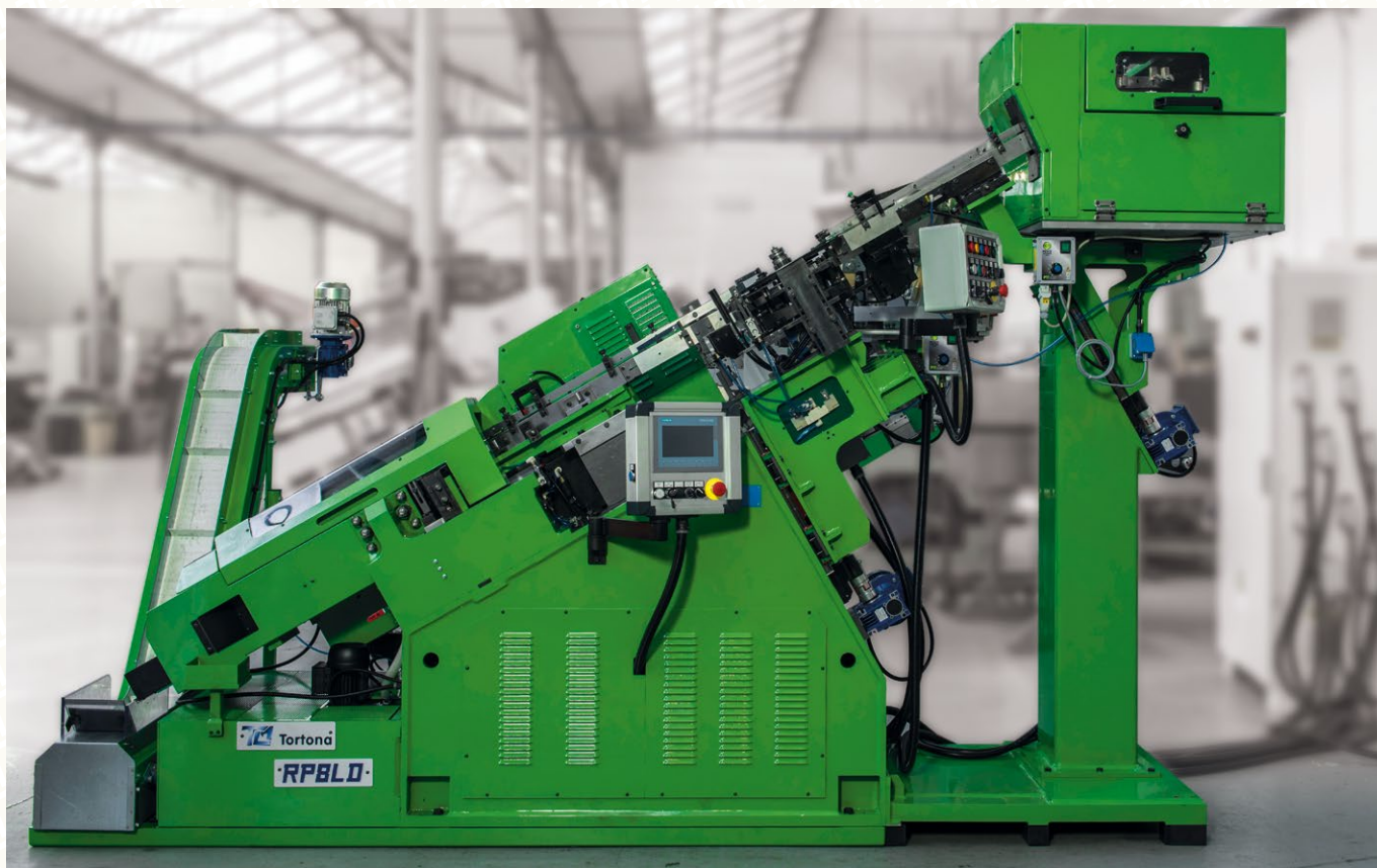
RP8/LD con slitta a pattini in combinazione con caricatore boccole speciale. Caricamento e rullatura boccole fino a 16 mm di diametro.